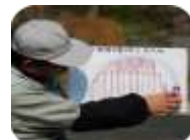
▲前回の第1回中国木材冠助成「やまもりの会」の活動風景