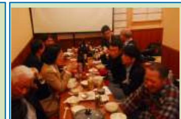
▲寄附付き交流会の様子

当財団の取組を広く知っていただくために、NPO活動支援に「理解ある方」に「めじろ金大使」を任命して広報して頂いています。