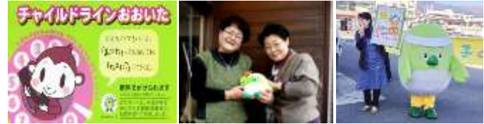
▲前年チャレンジ事業「チャイルドライン」の活動の様子

助成金をいただいたお蔭で、子どもたちへの電話番号を知らせるカードを配る回数を増やすことが出来、また、啓発フォーラムを開くことが出来たことで地域社会に認知され始めたと感じます。 その成果として、大分の子ども達からの電話の発信数が増え、大人の支援の輪も広がってきています。 ご寄附していただいた皆様に心より感謝いたします。皆様のお気持ちを大切にしながら、この活動を継続してより一層社会貢献していきたいと思っております。