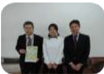
▲ハートフルウェーブ

2014年2月当財団で公募し、外部審査委員5名による厳正な書類審査を通過した3団体による公開プレゼンテーション（写真①）を同年3月1日に開催しました。いずれの団体提案も非常に素晴らしいものでありましたが、採択されましたハートフルウェーブから提案された不登校の学生を受け入れる フリースクール運営のサポートをする人材を育成する事業が、特に外部審査委員の評価が高く、本年度の支援団体と致しました。現在、当財団職員と事業実施の準備をしています。事業進捗に関しては、当財団公式ホームページ等でお知らせいたします。