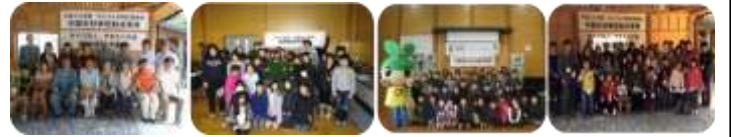
参加者写真① 参加者写真② 参加者写真③ 参加者写真④