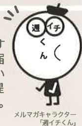
メルマガキャラクター「週イチくん」

メルマガ「週イチくん」にてNPOに関するお得で新しい情報を不定期にてお届けしています。また、お寄せいただいた情報等も配信し、みなさまに情報提供いたします。ご登録は「おんぼ」から。ご利用は無料です。